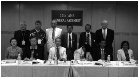
アジアマスターズ陸上競技協会理事会メンバー

一方で4年後のアジアマスターズ選手権開催地に決定したシンガポールは、陸連とマスターズが一体であり、効率的な競技運営が期待される。