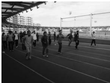
U-15陸上競技指導者中央研修会の様子