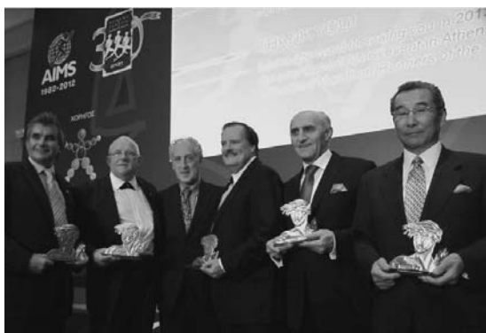
AIMSパコ会長（左から3人目）を囲んだ、5大陸の代表（右端は筆者）

福岡国際マラソンを育ててこられた関係の方々をはじめ、日本のランニングムーブメントを支えてこられた各大会関係者、指導者の方々、そして世界にチャレンジされた多くのランナーにも心からの感謝を捧げ、代表して表彰を受け、大変感銘致しましたことを報告申し上げます。