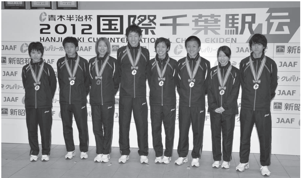
日本代表チームのメンバー