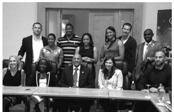
IAAF選手コミッションメンバー

今回の会議で議論された内容は、選手コミッションからの提言事項として、秋に実施されるIAAF理事会で報告される。