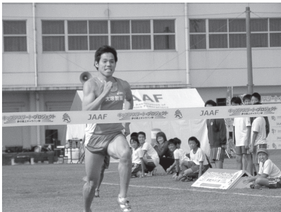
金丸選手のデモンストレーション

徳島の会場は、阿波市吉野グラウンド。キッズプロジェクトの会場として、はじめて、学校外で行いました。参加した2つの小学校の中間地点にあり、いつも子どもたちが利用しているグラウンドです。参加したのは、地元大塚製薬所属、今夏のロンドンオリンピック400m、4×400mリレーに出場した金丸祐三選手、同オリンピックで選手団主将を務めた、やり投の村上幸史選手、モンテ